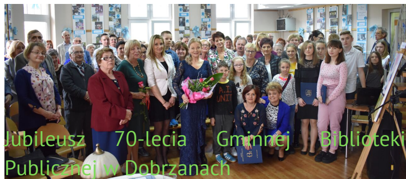
Jubileusz 70-lecia Gminnej Biblioteki Publicznej w Dobrzanych

W piątek 17 maja br. Gminna Biblioteka Publiczna w Dobrzanych obchodziła jubileusz 70-lecia swojej działalności. W tym dniu mieliśmy okazję wrócić do początku historii biblioteki i ludzi, którzy ją tworzyli. Niewątpliwie największą jej wartością byli czytelnicy i pracownicy, stanowiący duszę biblioteki oraz kształtujący jej kierunek rozwoju.