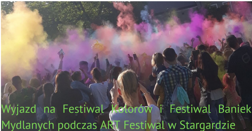
Wyjazd na Festiwal Kolorów i Festiwal Baniek Mydlanych podczas ART Festiwal w Stargardzie

W sobotę 18 maja br. dla grupy wolontariuszy uczestniczących w zajęciach pozalekcyjnych w Gminnej Bibliotece Publicznej w Dobrzanach został zorganizowany, już po raz drugi, wyjazd kulturalno-integracyjny na Festiwal Kolorów i Festiwal Baniek Mydlanych do Stargardu.