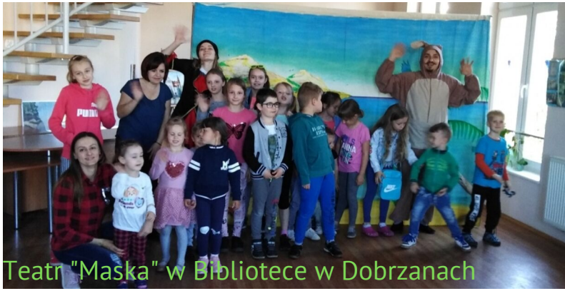
Teatr "Maska" w Bibliotece w Dobrzanach

W dniu 14 maja br. z okazji jubileuszu 70-lecia Gminnej Biblioteki Publicznej w Dobrzanach oraz w ramach XVI Ogólnopolskiego Tygodnia Bibliotek najmłodszy widzowie mogli obejrzeć spektakl pt. „Prastara księżnica - skarb i tajemnica... Bo mądrość tkwi nie tylko w WiFi”. Bajka promowała czytelnictwo oraz świadome korzystanie z Internetu w sposób, który dostarczył młodym widzom wielu emocji, odrobiny strachu i wielkiej dawki radości, śmiechu, a nawet okazji do tańca.