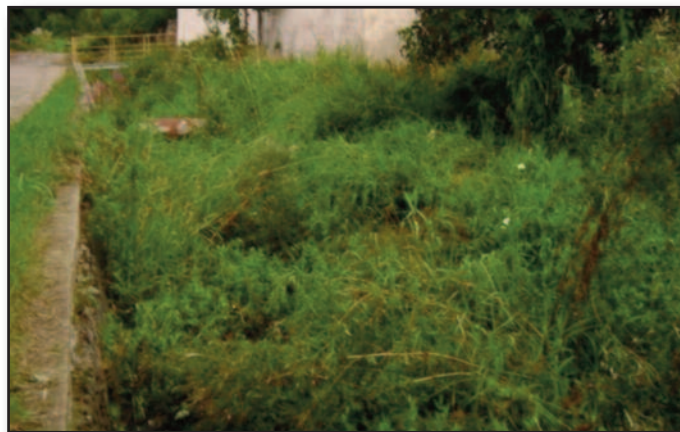
W trakcie prowadzonych robót.