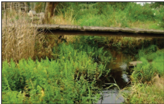
Rzeka Pęczinka przed robotami konserwacyjnym.